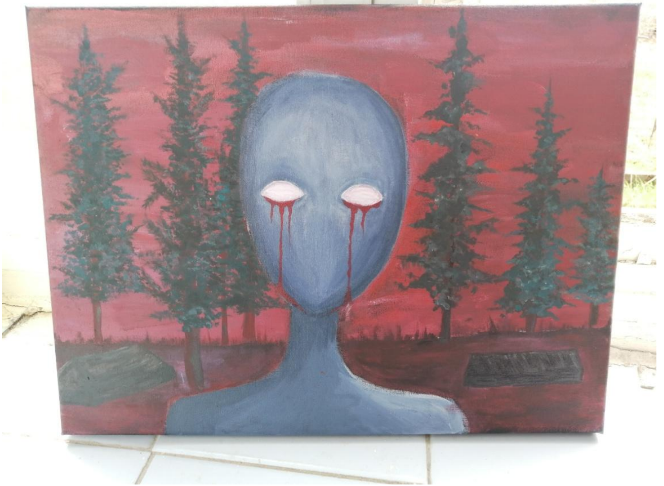
Урт – могильная душа (рис. 4.1.)