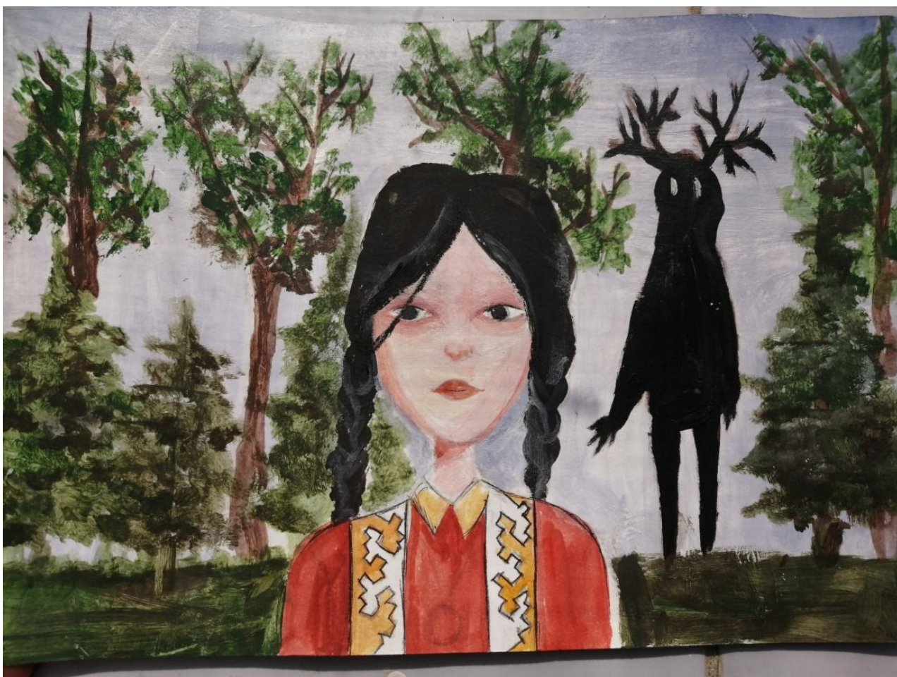
Я живу в Югре (рис.1)