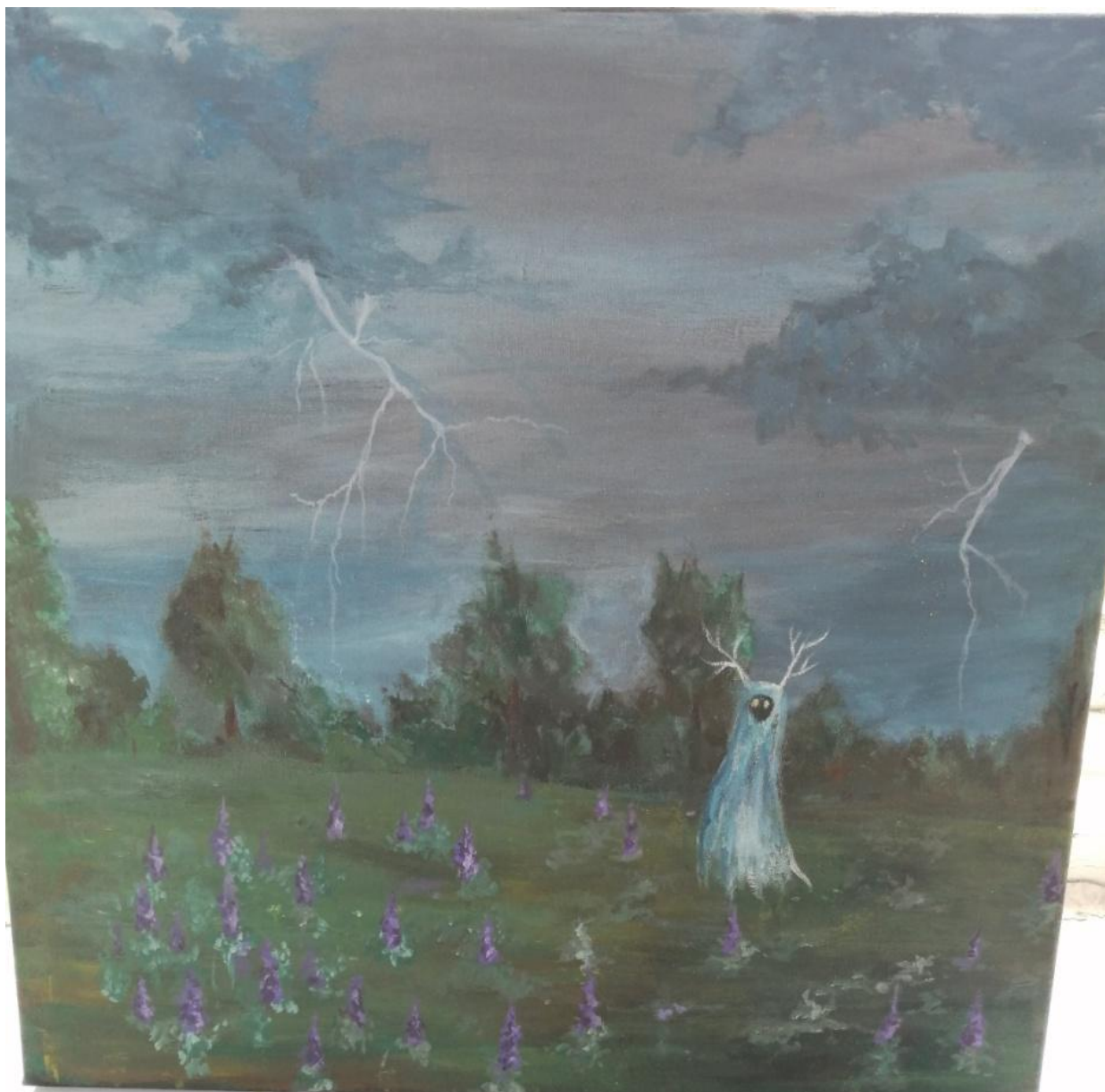
Комполен (рис. 4.3.)